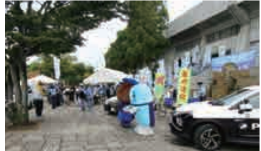
レイラック滋賀FC試合会場での啓発状況

各会場では、多くのサッカーファン、ゴルフファンで賑わう中、当センター、滋賀弁護士会、滋賀県警察本部、大津警察署等との共催でブースを展開し、「暴力団排除」、「不当要求断固拒否」等の啓発活動を実施しました。