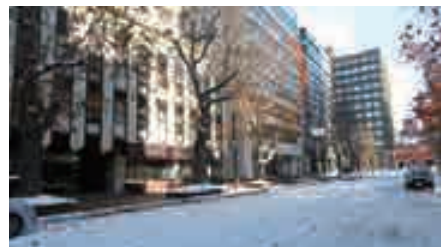
写真左～緑苑ビル、右奥～道庁赤レンガ

例年、警察本部・民暴弁護士・当センターの三者で、民事介入暴力対策研究会を開催していますが、個々の研究発表のみでディスカッションが減少傾向にあったため、本年度は当センターが事務所の使用差止め相談を受理する想定事例に基づき、如何なる業務があるか、三者の任務・役割等の時系列表を作成して議論したところ、これまでにない闊達な研究会となりました。