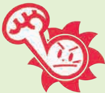
全国暴追センター・シンボルマーク 『パンチくん』