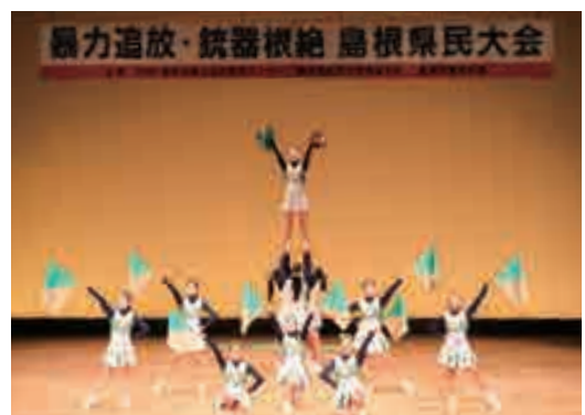
高校生によるパフォーマンス

トクリュウの実態、闇バイトに関わる若者が抱える問題や闇バイトに巻き込まれた場合の対応などの内容を高校生にも分かりやすく説明をしていただきました。